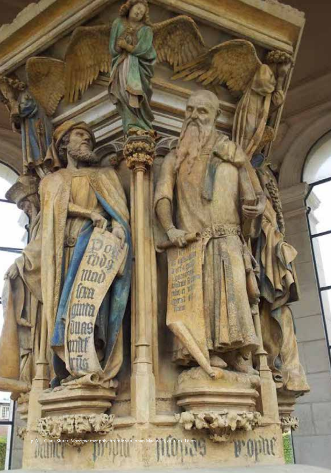
p. 6 Claus Sluter, Mozesput met polychromie van Johan Maelwael , ca. 1403, Dijon.