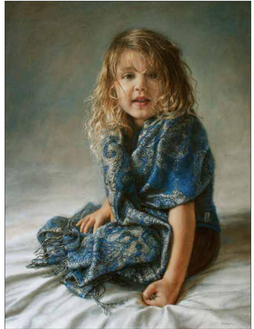
Ralf Heynen (1978, Tegelen) is autodidact en heeft een voorliefde voor verstilde momenten, de verfijnde uitwerking van wateroppervlakten, gecompliceerde stoffen en mysterieuze modellen, die in zichzelf gekeerd zijn. Voor meer informatie: www.ralfheynen.nl